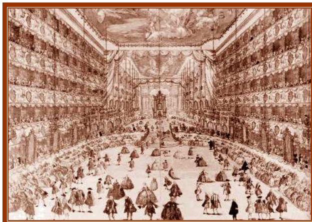
Milano - Il Teatro Ducale sito in Palazzo Reale. Nel 1771 vi fu rappresentato l' Ascanio in Alba

PRIMO E SECONDO VIAGGIO DIC. 1769 – DIC. 1771